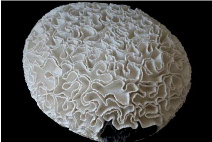
Corail crépon, 2015, porcelaine, 40 x 35 x 20cm

Galerie lionelle courbet 13 rue Oudinot, 75007 Paris