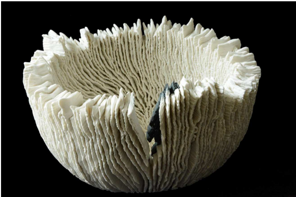
Fractura, 2015, porcelaine, 26 x 18cm