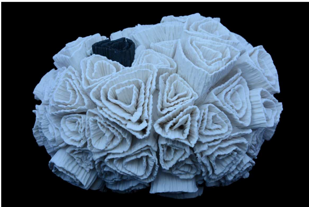
Zoanthus, 2015, porcelaine, 20 x 18 x 16cm

l'artiste a installé son atelier, la mer silencieusement inspiratrice. Volutes souples, sinuosités épanouies s'enroulent, se déroulent à l'infini en un espace élégant et minutieusement ramassé en boule, en galet, en rocher... tout un univers qui se déploie, vibre et se fige, fragile, comme en une étourdissante danse cosmique.